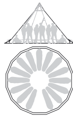
10120 Topas 15 B/P

Topas ist ein ausgezeichnetes, stabiles Zelt, das Gruppen genügend Platz bietet und trotzdem wenig wiegt und leicht zu handhaben ist.